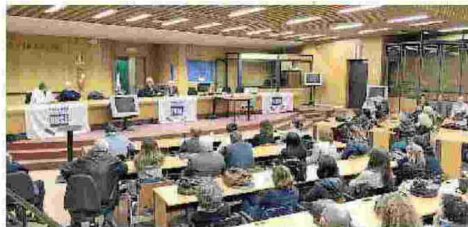
La protesta dei cancellieri del Tribunale

Se lo Stato non fa il proprio lavoro, questo equivale a un'istigazione a delinquere