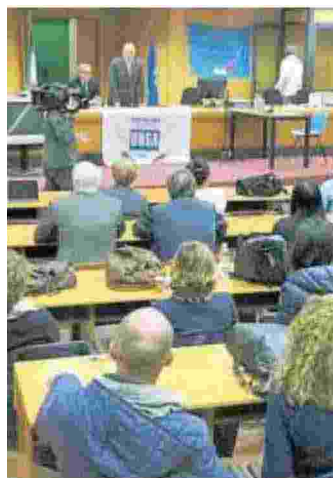
I cancellieri in assemblea